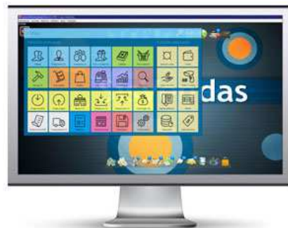
Híbrido (recomendado) Mistura da primeira com a segunda opção.

Onde: Menu manutenção, configurar o sistema, configuração avançada, guia estilo de navegação