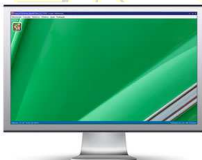
5 minutos depois