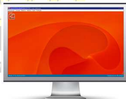
10 minutos depois

No exemplo acima, usamos alguns papéis de paredes disponíveis no Microsoft Windows como exemplo, porém você poderá usar fotos de seus produtos, com preços e informações para destacar suas vantagens e qualidade. Desta forma, durante a execução do sistema, os clientes serão atraídos pelas imagens que serão exibidas em seu monitor. Para isso, acesse o menu manutenção, configurar o sistema, configuração avançada, botão "várias imagens". Caso prefira introduzir o intervalo em minutos, clique na palavra segundo(s) .