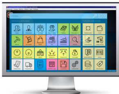
Formato moderno Com ícones em formatos de blocos acionados através da opção início.