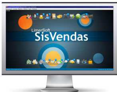
Desativada ou padrão da versão 10 Com ícones semi-transparentes e barras de navegação na parte superior e inferior da tela.

Projetada para facilitar ainda mais a vida dos usuários, a nova tela inicial pode ser configurada para ser usada em diferentes formas, sendo: